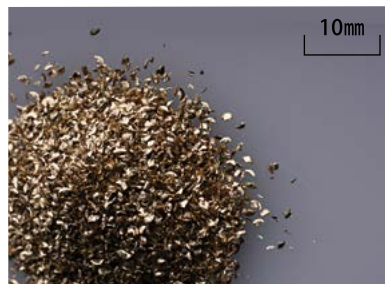
快削黄銅棒 (切削指数:100)