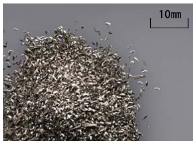
マニックZ-100 (切削指数:90)

快削黄銅棒の切削抵抗を100とした切削指数で各種材料を比較すると、マニックZ-100は快削黄銅棒に匹敵します。切粉の状況の一例を示します。