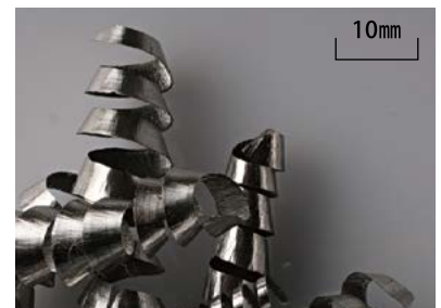
18-8ステンレス鋼 (切削指数:10)